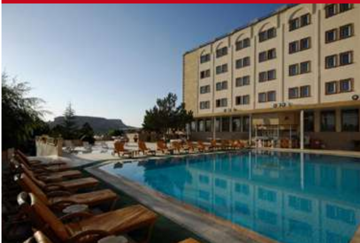
Dinler Hotel Urgup