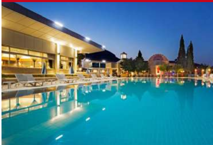
Colossae Thermal & SPA Pamukkale