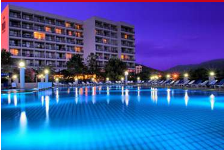
Tusan Beach Resort Kusadasi