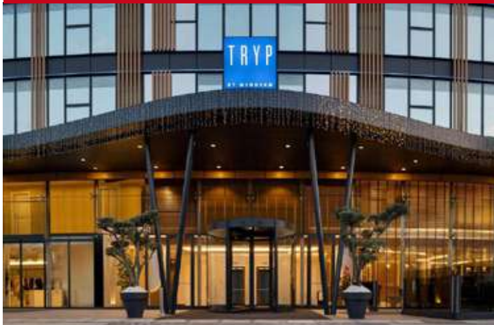
Tryp by Wyndam Beyoğlu