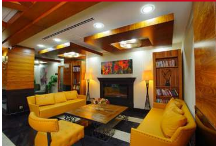
New Park Ankara