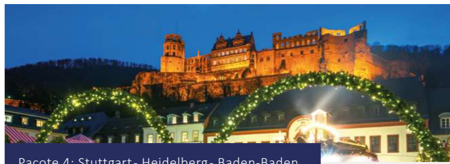
Pacote 4: Stuttgart - Heidelberg - Baden-Baden