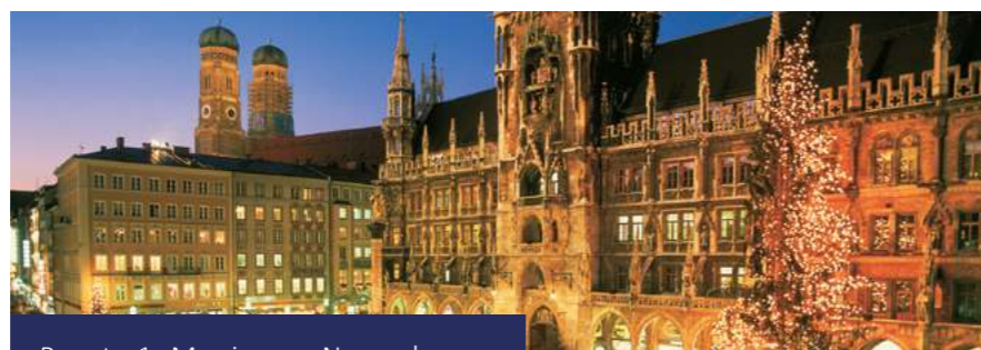
Pacote 1: Munique e Nuremberg