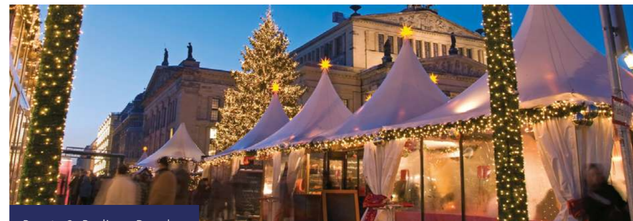
Pacote 2: Berlim e Dresden

Traslado privado opcional para o aeroporto.