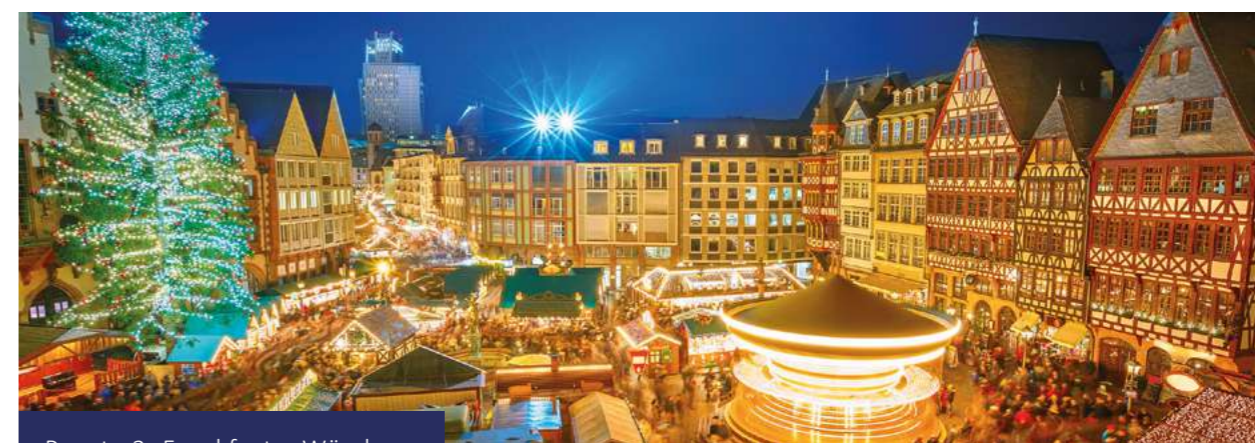
Pacote 3: Frankfurt e Würzburg

Traslado privado opcional para o aeroporto.