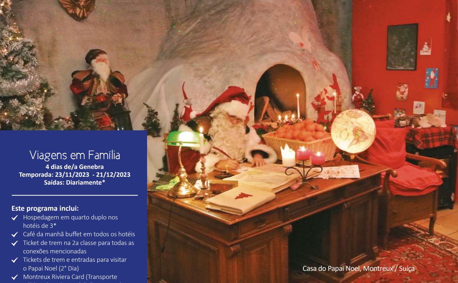
Casa do Papai Noel, Montreux / Suíça