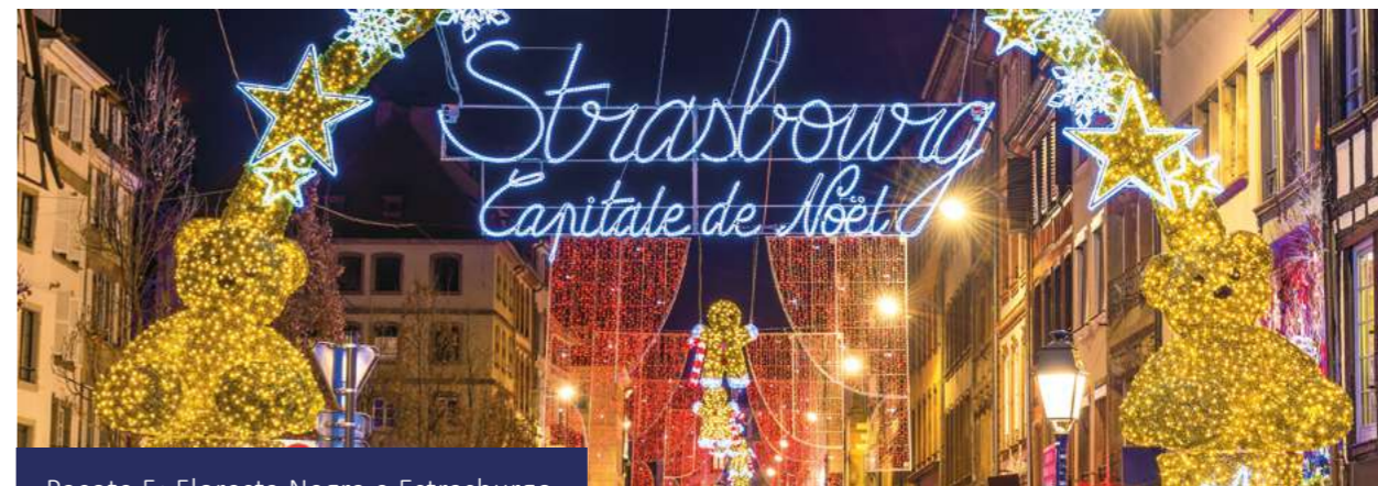
Pacote 5: Floresta Negra e Estrasburgo

Se tiver tempo suficiente, pode visitar opcionalmente o mercado de Natal em Esslingen, famoso por oferecer um ambiente medieval muito especial. Traslado privado opcional ao aeroporto.