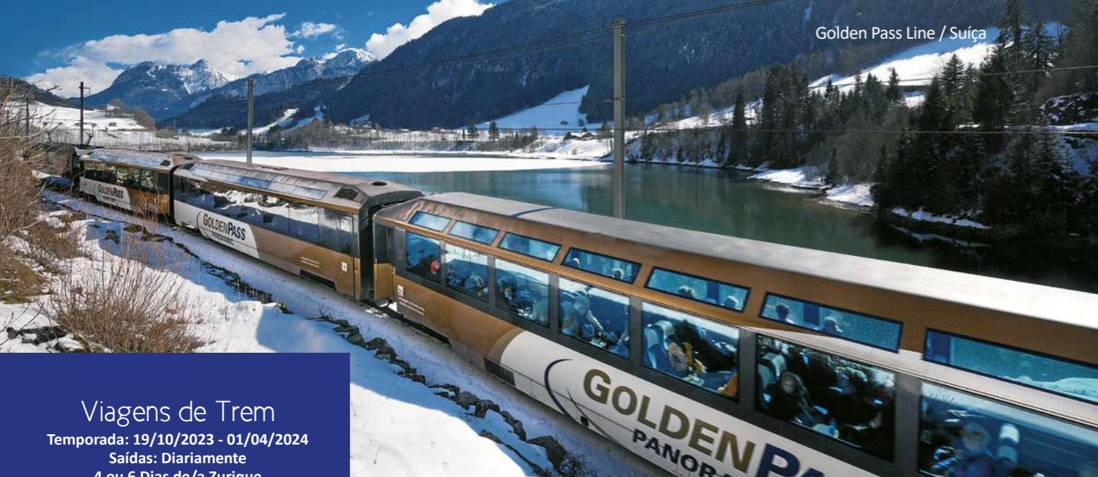
Golden Pass Line / Suíça