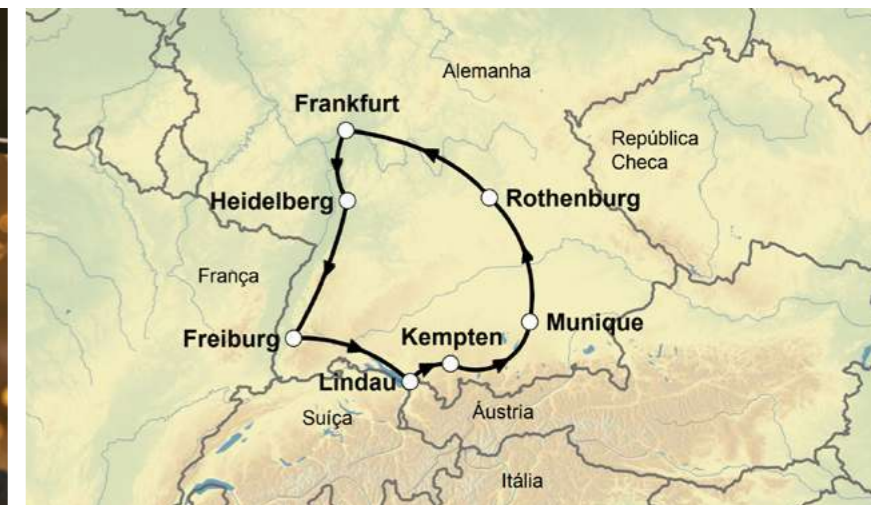
Munique / Alemanha

Nº de participantes 2 .....4.805,- 4 .....3.245,- 6 .....2.519,- Suplemento individual:.....365,- Viagem exclusiva para 2, 4, 6 pessoas ou grupos!