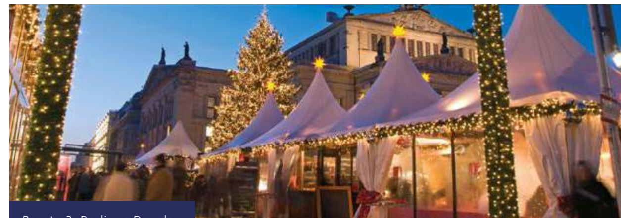
Pacote 2: Berlim e Dresden

Traslado privado opcional para o aeroporto.