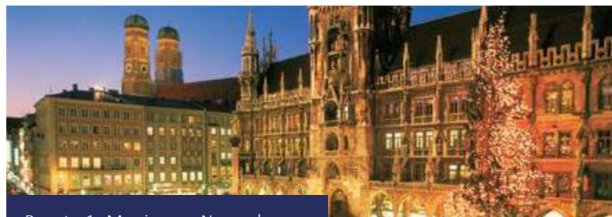
Pacote 1: Munique e Nuremberg