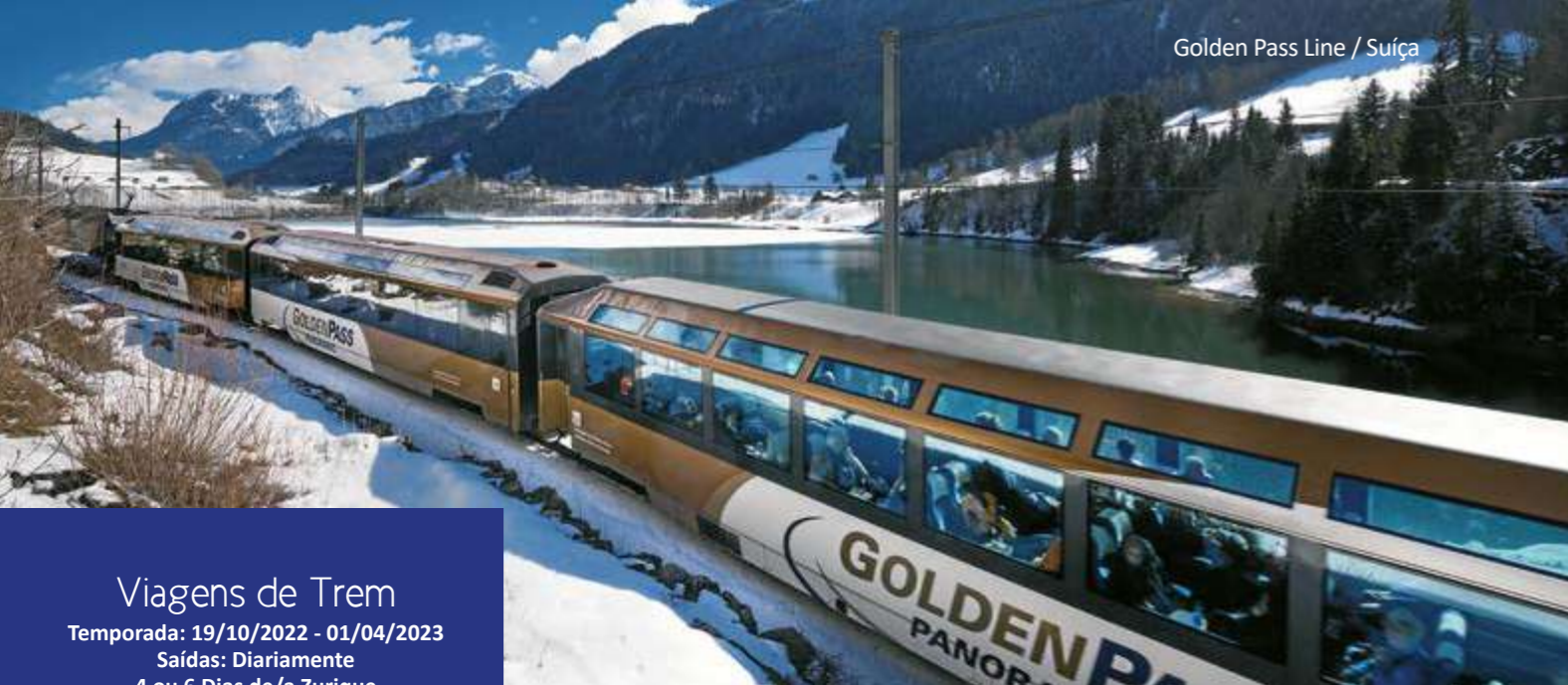
Golden Pass Line / Suíça