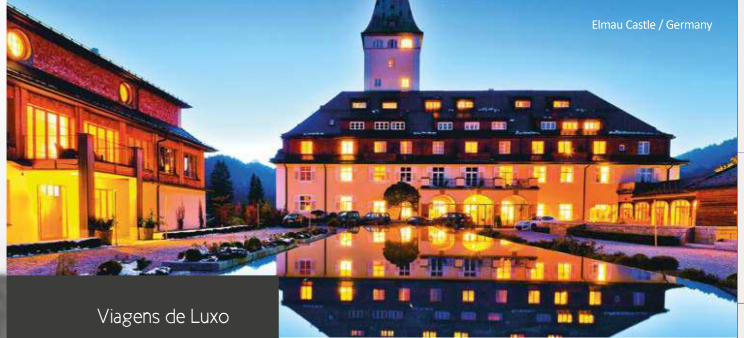
Elmau Castle / Germany

Faça compras em lojas de luxo com assistência personalizada - ajudamos a compor o seu „look“ individual.