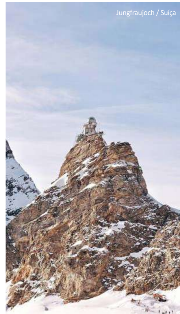
Jungfrauoch / Suíça

* exceto para trem da Jungfrauoch, aqui há somente assentos de 2ª classe