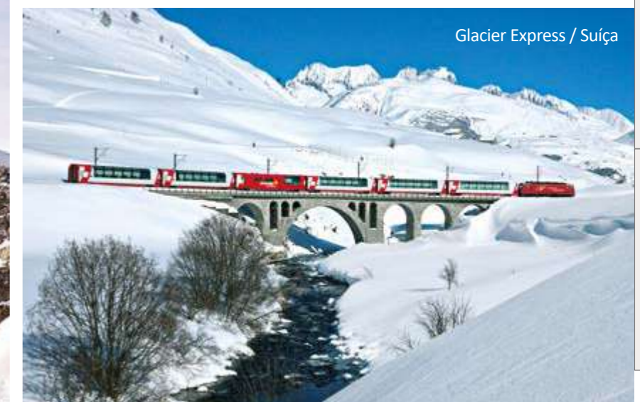
Glacier Express / Suíça