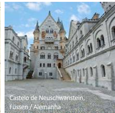
Castelo de Neuschwanstein, Füssen / Alemanha