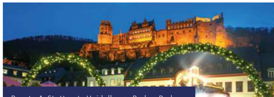
Pacote 4: Stuttgart- Heidelberg- Baden-Baden