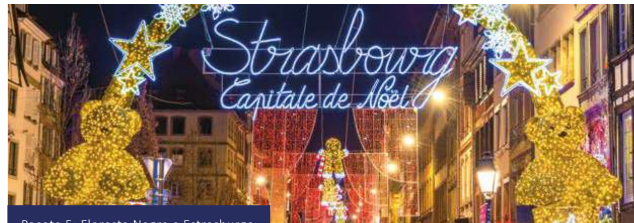
Pacote 5: Floresta Negra e Estrasburgo

Se tiver tempo suficiente, pode visitar opcionalmente o mercado de Natal em Esslingen, famoso por oferecer um ambiente medieval muito especial. Traslado privado opcional ao aeroporto.