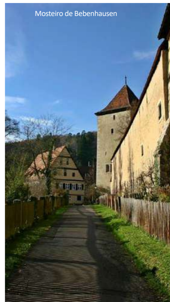
Mosteiro de Bebenhausen

Stuttgart não é apenas a sede da Mercedes-Benz e Porsche, é também uma das cidades mais verdes da Europa, com um belo centro histórico. Você pode ver obras arquitetônicas, como o Antigo Castelo Medieval, o Novo Palácio Barroco, o belo Mercado Markthalle e a colônia Weißenhof. A viagem termina no aeroporto de Stuttgart.