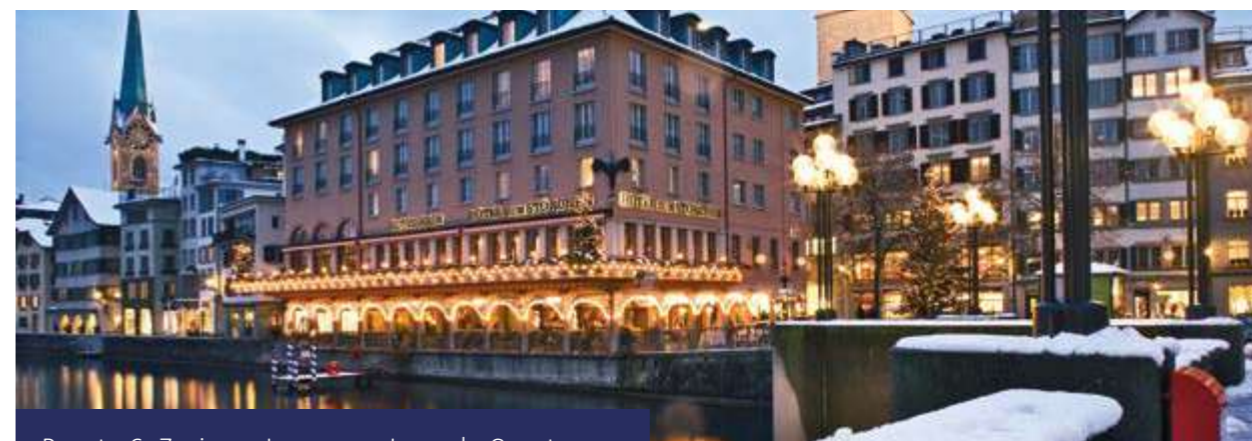
Pacote 6: Zurique, Lucerna e Lago de Constança