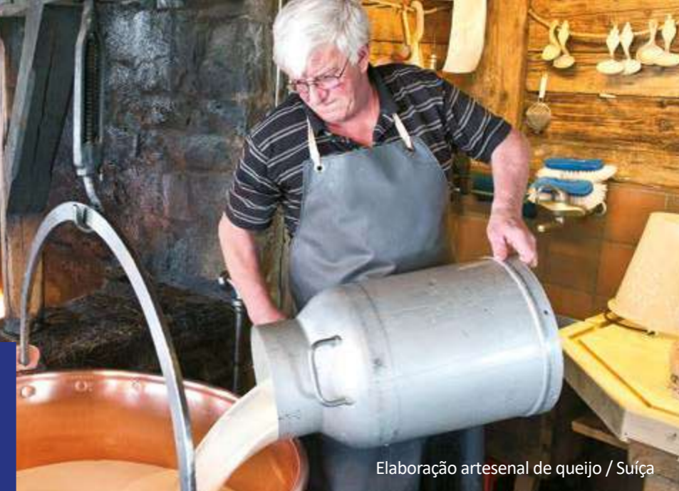
Elaboração artesanal de queijo / Suíça