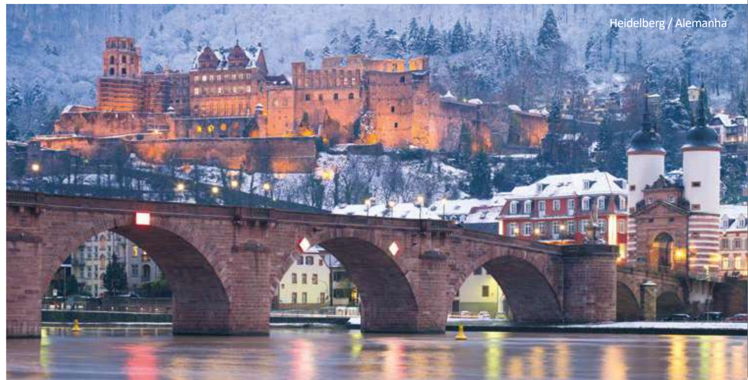
Heidelberg / Alemanha