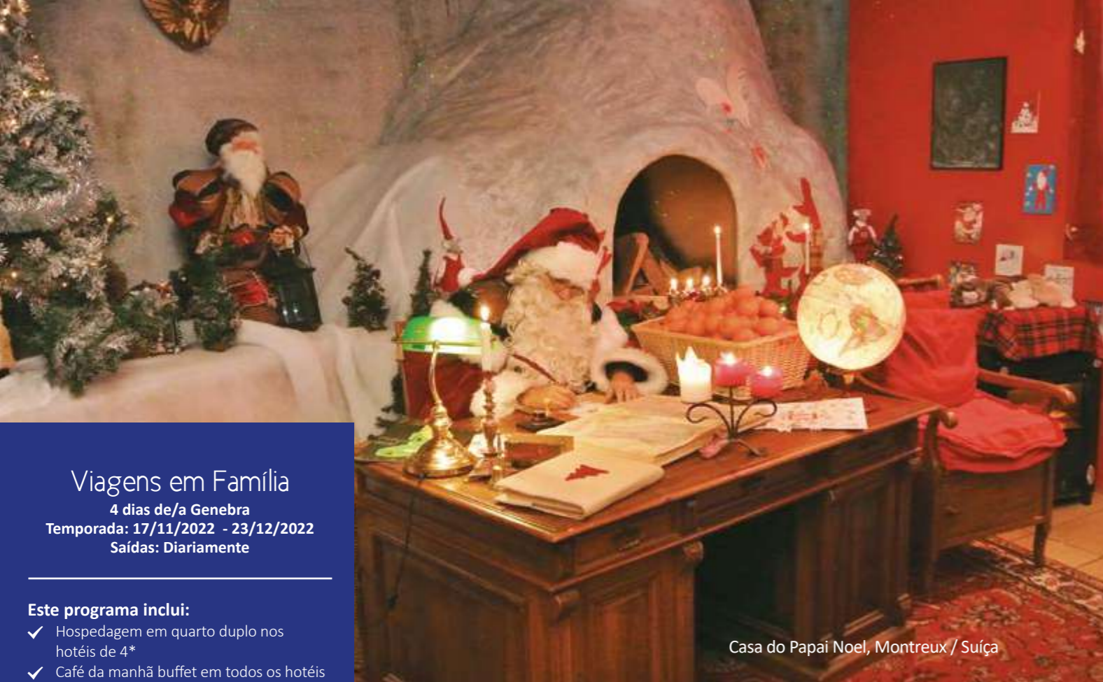
Casa do Papai Noel, Montreux / Suíça