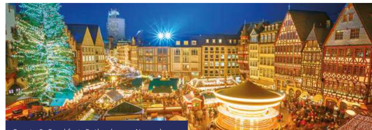
Pacote 3: Frankfurt, Rothenburg e Nuremberg

Traslado privado opcional para o aeroporto.